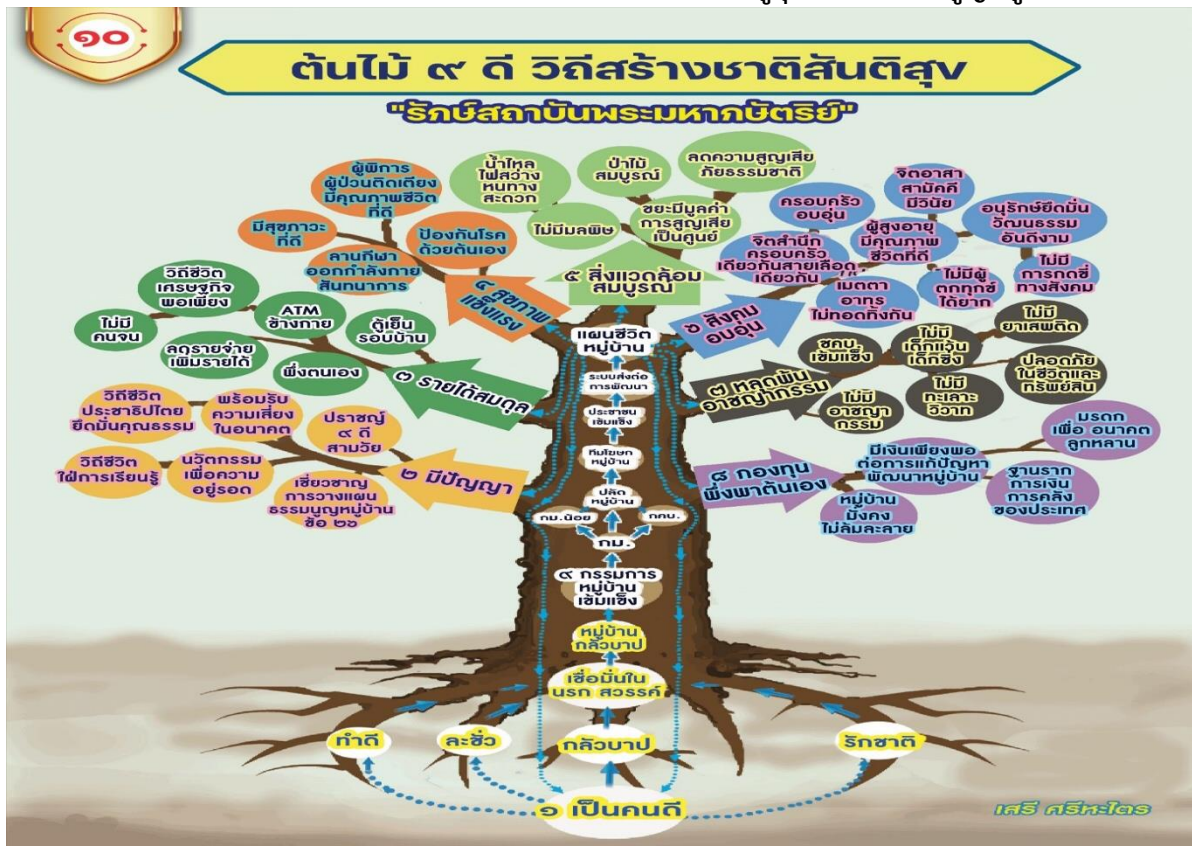
ภาพ:ดอกผลความสำเร็จของการขับเคลื่อนแผนชีวิตตามข้อกำหนดฮุกุมปากัด(ธรรมนูญหมู่บ้าน)๙ดี