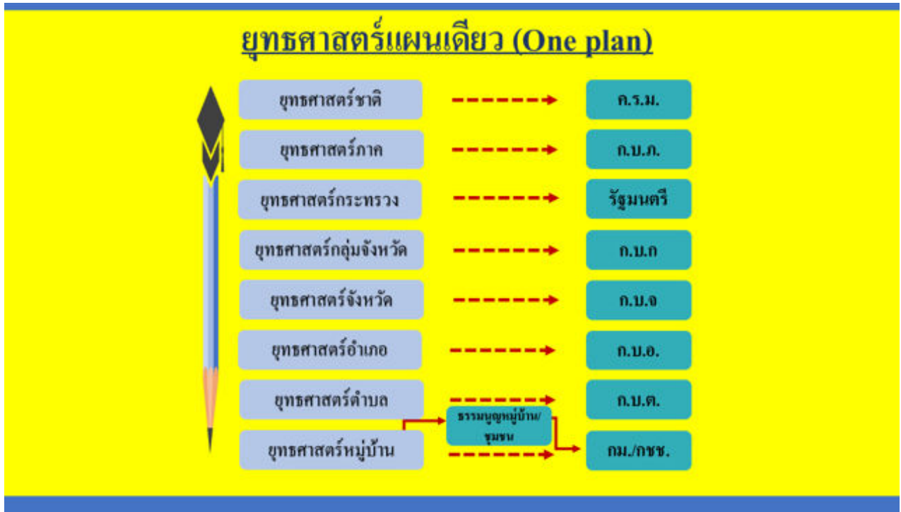
(๒)ภาพ:การหลอมรวมหนุนเสริมให้แผนชีวิตหมู่บ้านเป็นฐานรากยุทธศาสตร์แผนเดียว(One Plan)