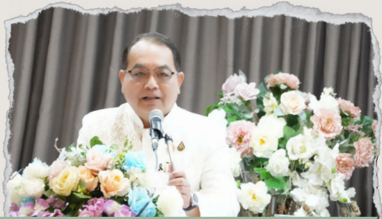
นายสุรศักดิ์ อินศรีไกร รองปลัดกระทรวงศึกษาธิการ

แผนปฏิบัติการฉบับนี้ จัดทำขึ้นตามพระราชกฤษฎีกาว่าด้วยหลักเกณฑ์และวิธีการบริหารกิจการบ้านเมืองที่ดี พ.ศ. 2546 หมวด 3 มาตรา 9 (1) และ (2) ที่กำหนดให้ส่วนราชการต้องจัดทำแผนไว้เป็นการล่วงหน้า โดยสอดคล้องกับยุทธศาสตร์ชาติ แผนแม่บทภายใต้ยุทธศาสตร์ชาติ พ.ศ. 2566 - 2570 (ฉบับแก้ไขเพิ่มเติม) แผนพัฒนาเศรษฐกิจและสังคมแห่งชาติ ฉบับที่ 13 พ.ศ. 2566 - 2570 และนโยบายและแผนระดับชาติว่าด้วยความมั่นคงแห่งชาติ พ.ศ. 2566 - 2570 รวมถึงนโยบายและแผนปฏิบัติการต่าง ๆ ที่เกี่ยวข้องในพื้นที่ ตลอดจนประกาศกระทรวงศึกษาธิการ เรื่องการจัดตั้งศูนย์ขับเคลื่อนการศึกษาในจังหวัดชายแดนภาคใต้ ให้เป็นหน่วยงานการศึกษาที่จัดทำนโยบาย ยุทธศาสตร์ และแผนปฏิบัติการเกี่ยวกับการศึกษาแบบร่วมมือและบูรณาการในจังหวัดชายแดนภาคใต้ ที่สอดคล้องกับนโยบายและแผนระดับชาติว่าด้วยความมั่นคงแห่งชาติ และพระราชบัญญัติการรักษาความมั่นคงภายในราชอาณาจักร พ.ศ. 2551 และแผนอื่นที่เกี่ยวข้องสภาพท้องถิ่น และพื้นที่ที่เกี่ยวข้องอันส่งผลให้ประชาชนในจังหวัดชายแดนภาคใต้อยู่ดีกินดี และมีความสุขอย่างยั่งยืน